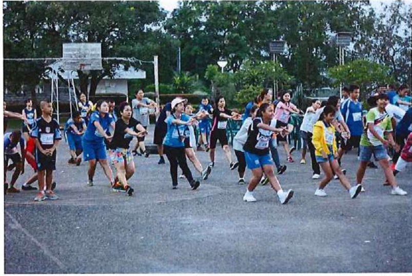
○ จัดทำโครงการจากการสานเสวนากับพนักงาน